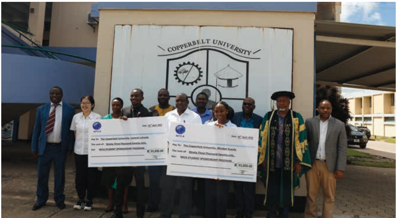
2025年4月3日，中色非洲礦業向銅帶省大學學生捐贈助學金

我們不斷加強公司信息披露的質量及效率、遵守各項適用法律及法規，並積極參與公益活動，力求最終達到與相關方共同成長、共享價值。對應不同利益相關方的關注重點，我們也制定了相應的關鍵指標來反應我們在這些議題上的管理績效。這些關鍵指標包括了針對投資者的分紅率及股息率；關於員工及員工組織的員工培訓率及流失率；政府所關注的違法違規次數及安全與環境績效；公眾所關注的輿論及品牌形象；公益慈善及社區活動方面的投入以及客戶的滿意度調查等。今後，我們會繼續努力改善我們的現行制度並致力實現利益相關方的最大價值及與其的合作共贏。