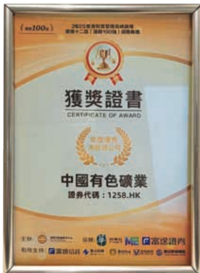
2025年度優秀港股通公司