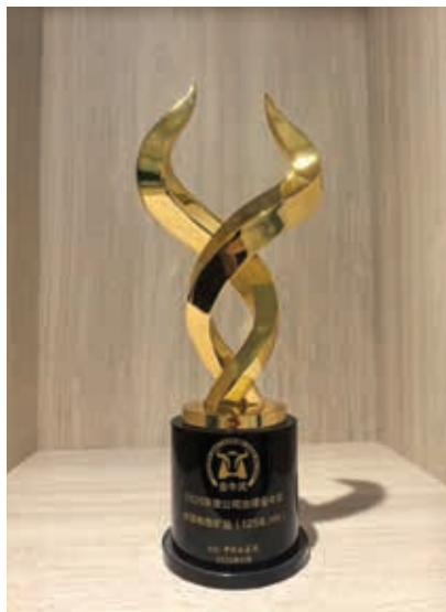
中國證券報2025年度公司治理金牛獎

本集團重視與股東及投資者保持良好溝通，以便增加本集團的透明度及促進股東履行承諾。股東周年大會為股東與董事會交流意見提供一個良好場所。董事會主席出席股東周年大會並邀請審核委員會、薪酬委員會、提名委員會的主席出席。董事會各成員均樂意回答股東提問。為促進本集團、股東及潛在投資者之間的雙向溝通，本集團設立了投資者關係專員，負責回答股東及公眾的查詢。若股東有意向董事會提出任何建議，可致函本集團投資者關係專員，投資者關係專員將會處理有關事宜。本集團還樂意通過個別及小組會議與股東及投資者保持持續溝通。此外，本集團致力於充分發揮公司網站的作用，及時提供最新資訊，加強與股東及公眾的溝通。