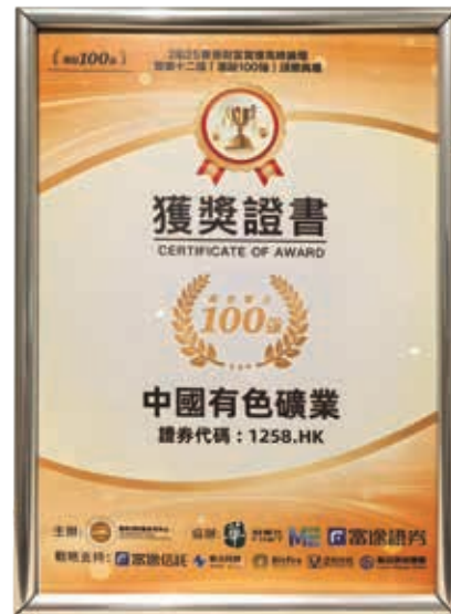
2025年度港股綜合實力100強