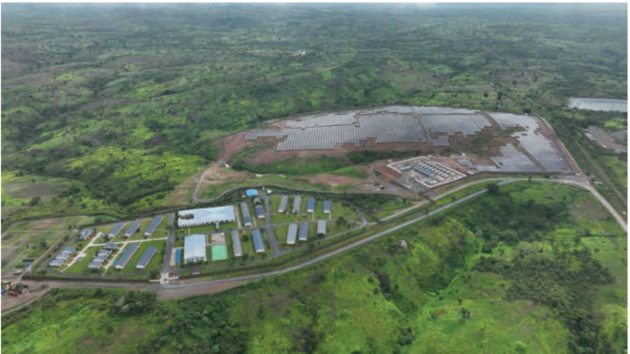
剛波夫礦業光儲電站

董事會負責領導、監控及管理本公司，主要職責包括(但不限於)：(i)制定及檢討本公司的企業管治政策及常規；(ii)檢討及檢查董事及高級管理人員的培訓及持續發展；(iii)檢討及監察本公司在遵守法律及監管規定方面的政策及常規；(iv)發展、審查並監督適用於員工和董事的行為道德準則及合規手冊；及(v)檢討本公司遵守企業管治守則的情況以及在本年報的企業管治報告(「企業管治報告」)內的披露。董事會監察本集團之業務、策略決策及表現，以促進本公司良性增長及提升股東價值。每名董事在執行職務時必須真誠行事，遵守適用法例及法規之規定，客觀作出決策。董事會指派本集團管理層負責本公司的日常運營並指示管理層執行董事會的決定及決議。本公司將對指派職能定期進行檢討。訂立任何重大交易前，須獲得董事會批准。非執行董事及獨立非執行董事積極參與董事會會議和委員會會議，就戰略事宜、政策、業績、問責、資源、重要委任及本公司之行為標準等事項各自作出獨立判斷。本公司所有非執行董事及獨立非執行董事發表了獨立且富建設性之知情意見，對本公司發展戰略和政策貢獻良多。此外，董事會還將各種職責指派予審核委員會、提名委員會、薪酬委員會及合規委員會負責。