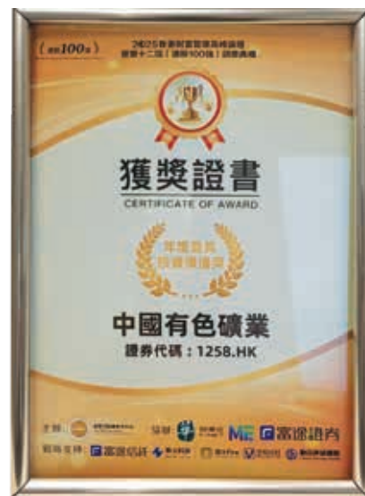
2025年度最具投資價值獎