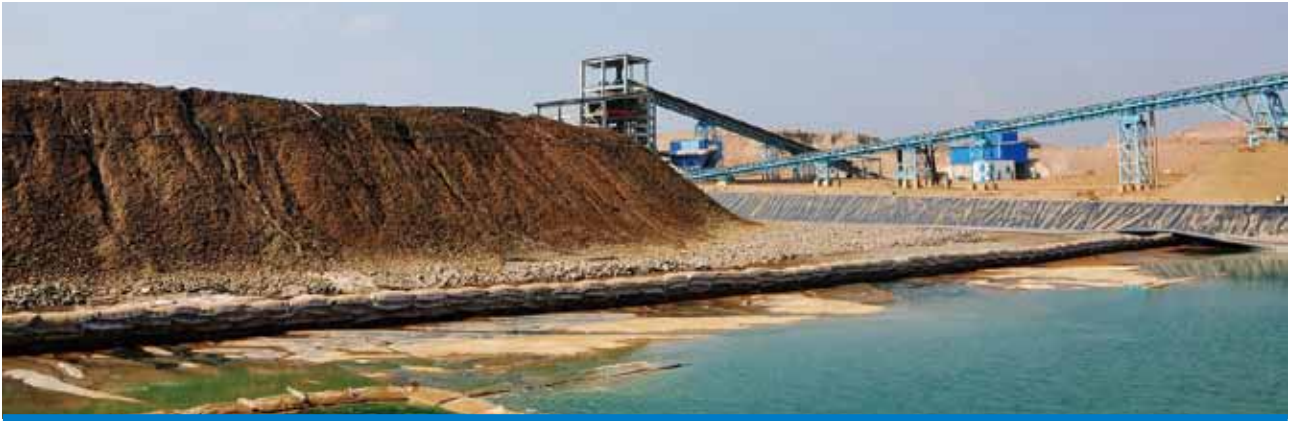
穆利亞希項目噴淋後浸出液