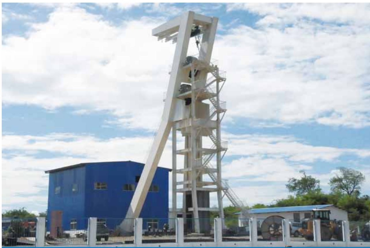
謙比希銅礦西礦體中央副井

本集團積極推進的謙比希銅冶煉二期擴建項目主體工程於2014年4月30日完工，尾項工程於2014年12月底完工。該項目已具備年產粗銅25萬噸和硫酸60萬噸的生產能力。項目總投資21,144萬美元，截止2014年底累計完成投資15,168萬美元，完成投資比例71.74%。