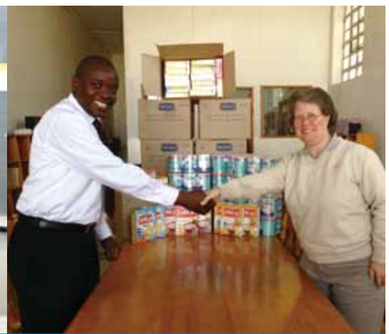
中色盧安夏向當地嬰 幼兒捐贈食品