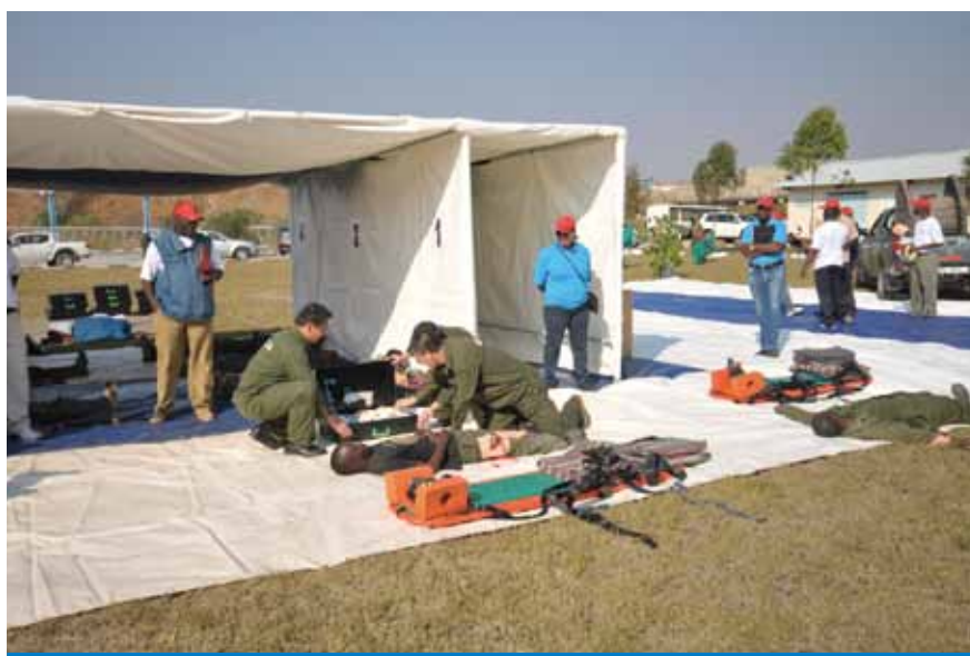
中色非洲礦業經理層參加礦山急救冶煉競賽

本集團於截至2014年12月31日止共聘有僱員7,004人（2013年12月31日：6,482人）。本集團按照僱員之工作表現、經驗及當時之行業慣例釐定僱員（包括董事）薪酬。僱員更可按表現獲得花紅以作為獎勵。截止2014年12月31日止，反映在綜合全面收益表中之僱員總成本約為97.7百萬美元（2013年：96.6百萬美元）。