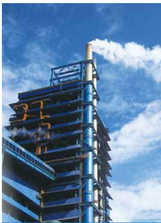
銅冶煉公司ISA爐廠房