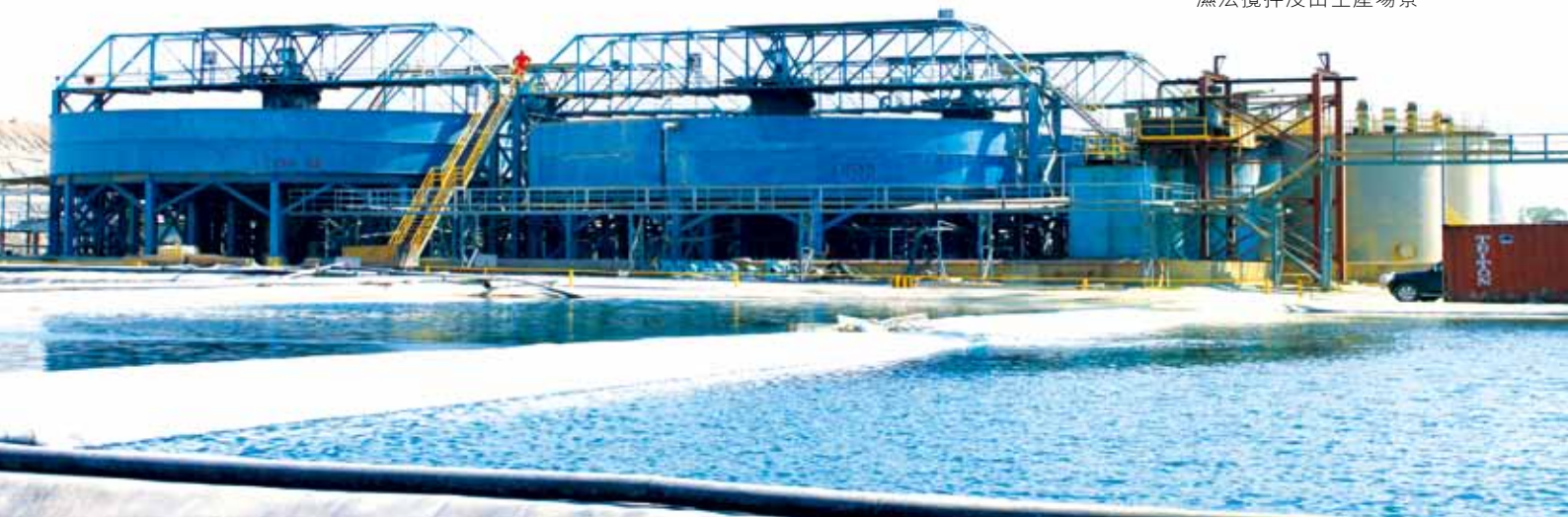
濕法攪拌浸出生產場景

本集團2014年全年收益為1,942.0百萬美元，較2013年全年的1,744.0百萬美元增長11.4%。本集團粗銅、陰極銅、硫酸和鈹的收益佔總收益比例分別為79.1%、17.4%、3.4%以及0.1%。