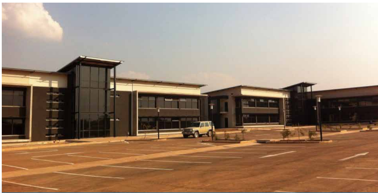
謙比希濕法冶煉剛果（金）盧本巴希辦公區

公司網站為與投資者溝通最快捷的方式之一。資訊透過本集團網站 www.cnmc.net 傳遞，作為對外界的溝通平台。本集團定期更新網站內容，發放本集團的最新資訊，讓外界可適時獲取有關資訊。此外，本集團亦會通過電郵、傳真及電話方式，及時回應股東、投資者、分析員及傳媒的各種查詢，並以發放公告、新聞稿及其他有關本集團動向的最新資訊，以加強資訊傳遞的有效性。