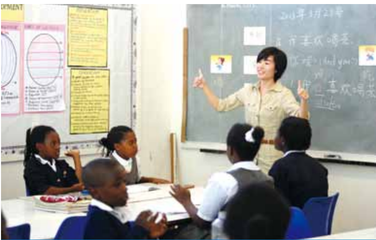
中色盧安夏信託學校志願者在教授中文