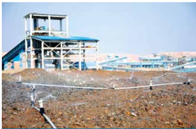
Muliashi項目堆浸系統1號堆場噴淋作業

2. 2014年主礦體無開發性勘探深部礦體探礦鑽孔。完成生產探礦坑內鑽孔47個／進尺4,500.2m。