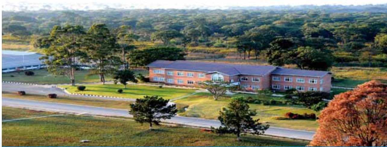
綠樹叢中的中色非洲礦業中心辦公樓

2014年，本集團累計生產了粗銅222,224噸，陰極銅56,492噸，硫酸612,598噸，分別較去年增長了10.5%、46.0%和17.0%；2014年本集團收益由2013年的1,744.0百萬美元增至1,942.0百萬美元，增幅達到11.4%。