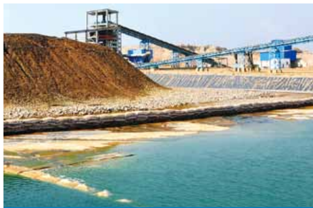
Muliashi項目噴淋後浸出液