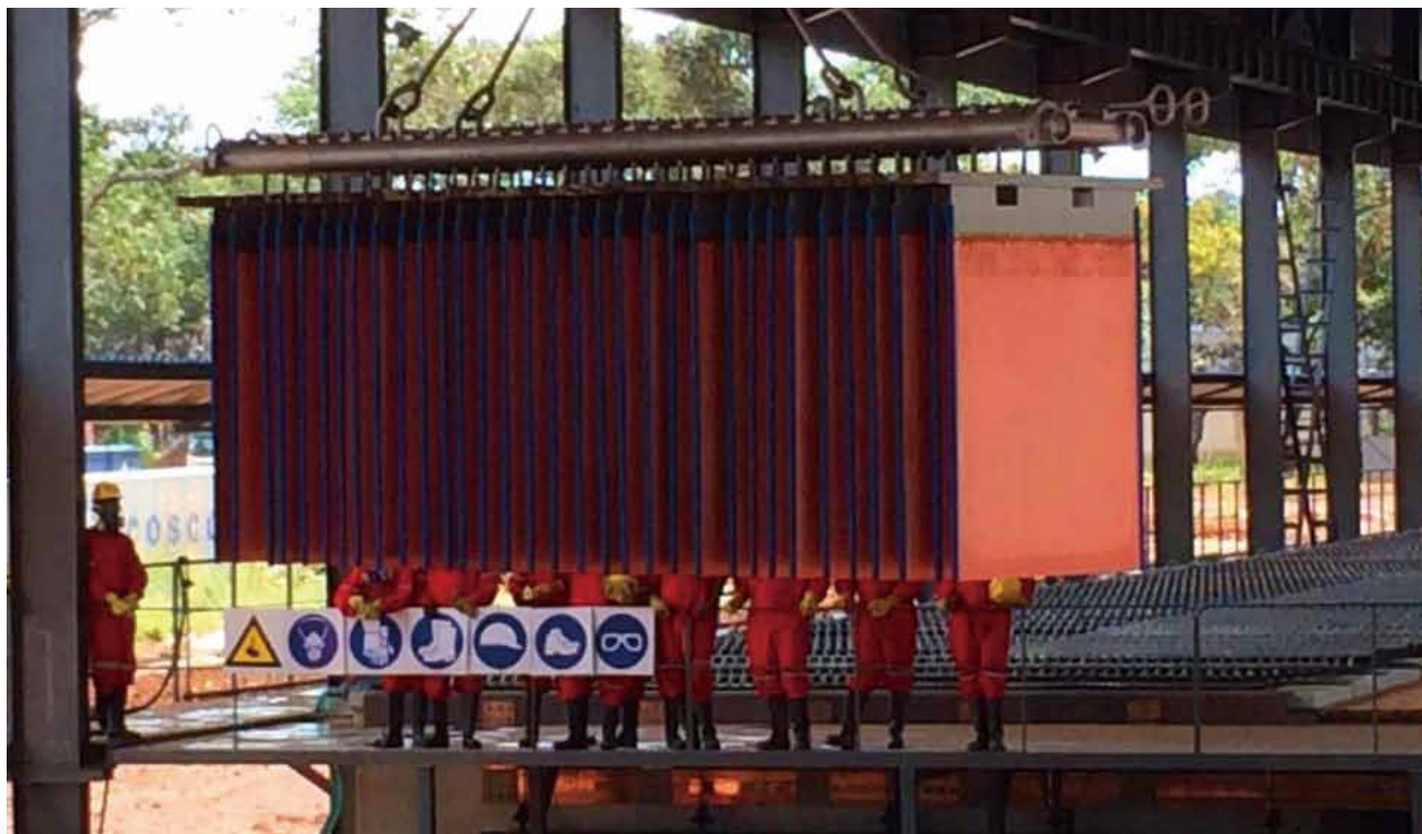
馬本德項目工人吊裝陰極銅產品(2014年3月生產第一批產品)

謙比希濕法冶煉通過中色華鑫馬本德建設及經營一個年產陰極銅20,000噸的濕法廠項目(「中色華鑫馬本德項目」)，投資總額1.48億美元。截止2014年底，累計完成投資1.48億美元，完成投資比例100%。中色華鑫馬本德項目2013年4月開工建設，於2014年3月系統形成生產能力生產出第一批陰極銅。