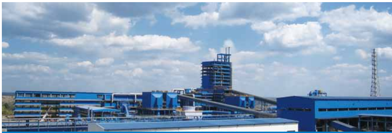
銅冶煉公司廠房全景

* 就轉包安排而言，這是指某一合同的當事人，與合同之外的第三人所訂立的，內容涉及由第三人全部或部分履行原合同義務的安排。舉例而言，即指本集團在承包某項工程後，繼而將承包的工程轉讓或部分發包給第三人的情形。