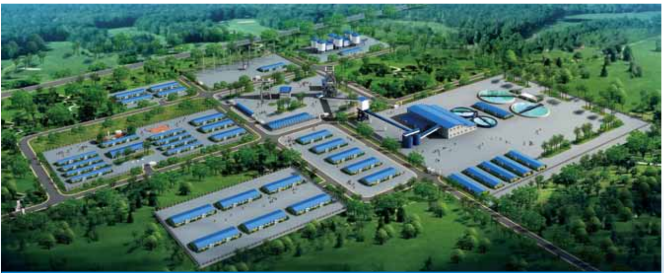
謙比希銅礦東南礦體採選工程鳥瞰圖