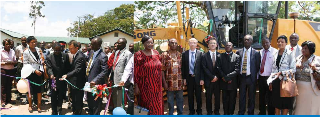
中色非洲礦業向當地市政廳捐贈平路工程車及建設圍牆

2014年，本集團以貨幣資金、實物資產、施工建設等多種形式積極參與贊比亞當地社會公益事業，扶持市政和社區建設、捐贈圖書、食品及醫療用品、捐建校舍、贊助當地文化、體育事業。其中，中色盧安夏所屬的礦山醫院與當地政府衛生部門合作，積極開展防控熱帶流行病、傳染病、地方病的工作，參與防控埃博拉疫情，提供社區消毒、發放預防埃博拉疫情知識的宣傳材料等。得到了當地政府和居民的高度讚賞，進一步鞏固了中贊經濟合作典範的良好形象。