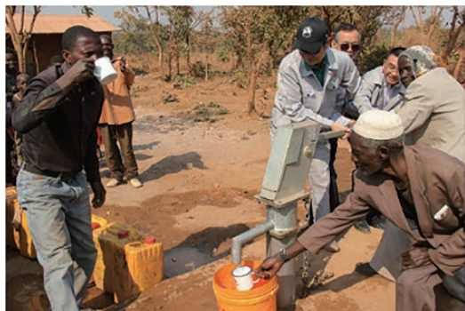
為村民免費打好的水井出水啦！