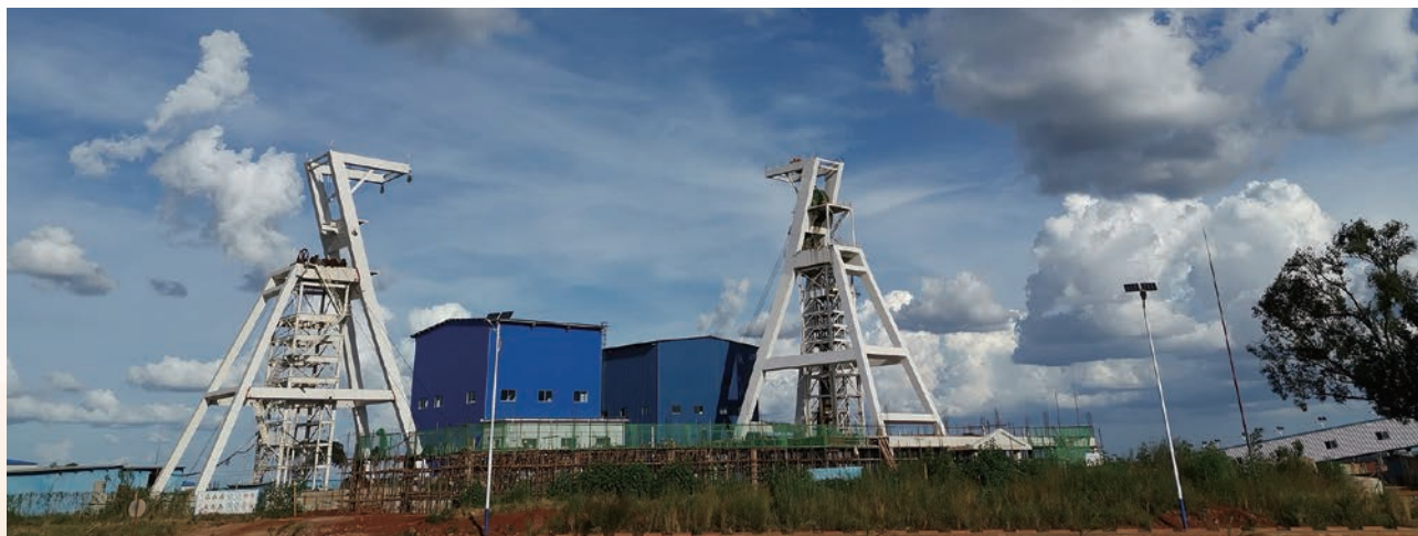
謙比希東南礦體主井及副井

中色非洲礦業有限公司*(「中色非洲礦業」)謙比希東南礦體探建結合項目是本集團重點開發的礦山項目之一。截至2019年6月30日，項目累計完成總投資7.86億美元，完成項目總投資的94.7%。