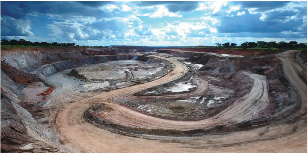
穆利亞希露天採礦場