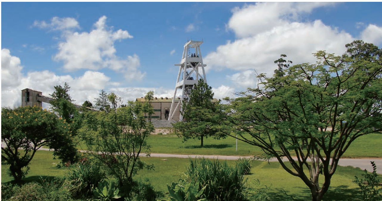
謙比希西礦中央主副井

香港中央證券登記有限公司 香港灣仔 皇后大道東183號 合和中心17樓1712-1716室