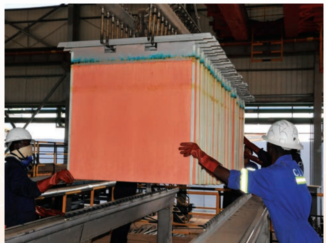
穆利亞希項目電極車間