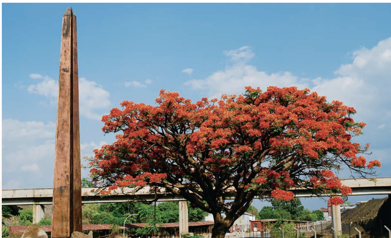
盧安夏銅礦發現紀念碑

於截至2019年6月30日止六個月期間，本公司或其任何附屬公司概無購買、贖回或出售其任何上市證券。