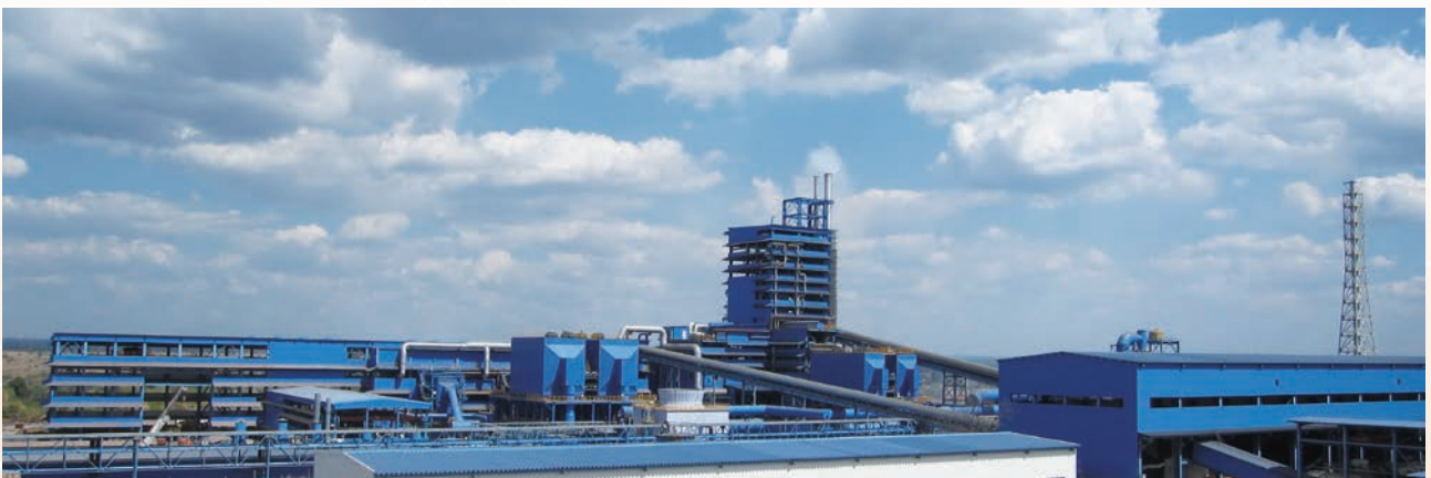
銅冶煉公司廠房全景