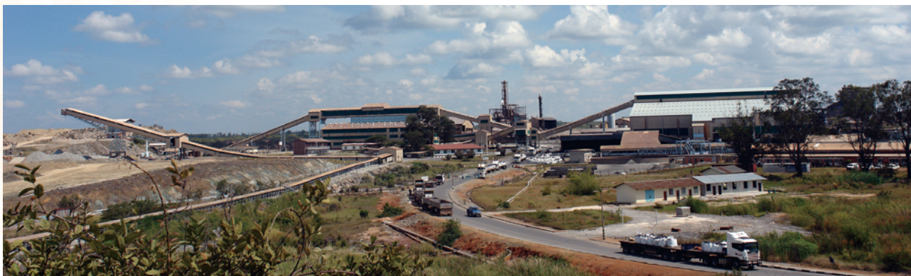
謙比希銅礦選礦廠全景