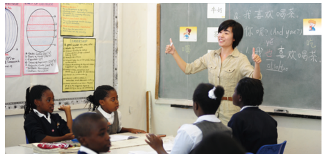
中色盧安夏信託學校志願者在教授中文