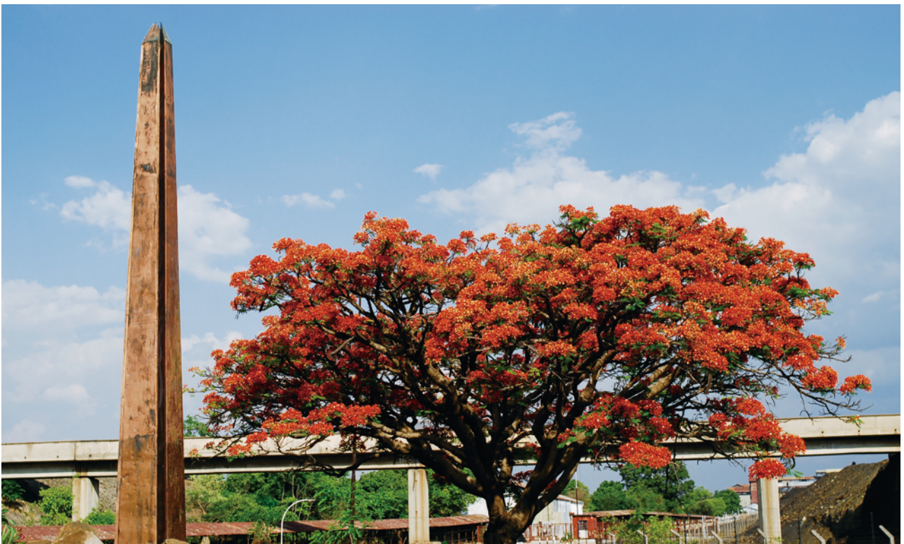
盧安夏銅礦發現紀念碑

於截至2017年6月30日止六個月期間，本公司或其任何附屬公司概無購買、贖回或出售其任何上市證券。