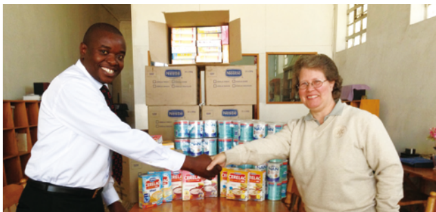
中色盧安夏向當地嬰幼兒捐贈食品

本集團嚴格遵守企業所在地的有關安全生產和勞動保護等法律法規，始終堅持「安全第一、預防為主」的安全生產方針，自集團至各附屬公司均牢固樹立「尊重生命、防範為先」的安全生產理念，通過落實安全生產主體責任、明確安全生產責任範圍，加強安全生產教育和風險防控，開展全範圍安全檢查及隱患排查治理工作，不斷健全完善應急預案，加強應急救援隊伍建設，安全生產工作管理水準得到切實提高。本集團高度重視安全環保設施的投資建設，高度重視員工勞動防護用品的配備和使用管理。在每個礦山和工廠均建立了緊急救護隊並配備了完備的裝備，設立了醫療救護站。2017年上半年，本集團安全生產繼續保持了穩定局面。