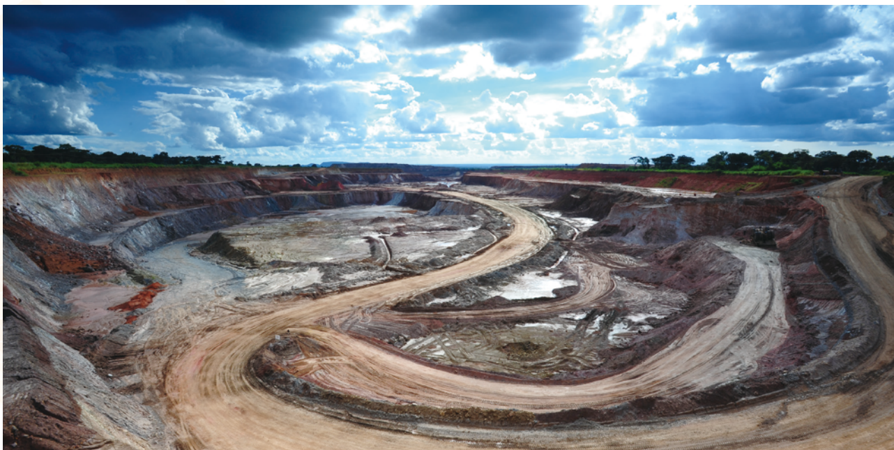
穆利亞希露天採礦場