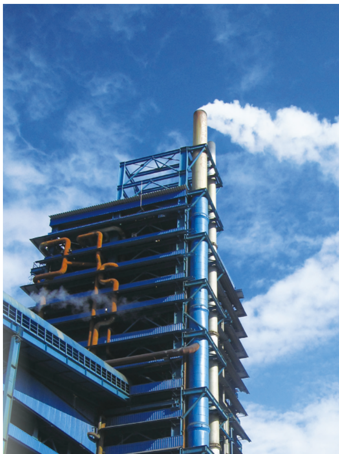
銅冶煉公司ISA爐廠房