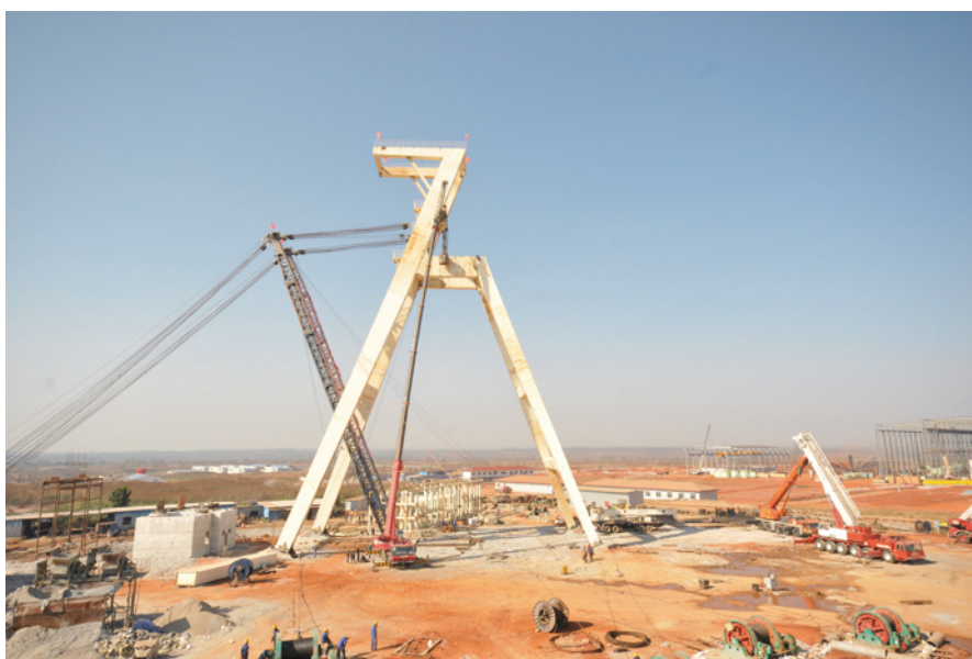
東南礦體主井井架安裝

本集團將繼續貫徹「創新、協調、綠色、開放和共用」的發展理念，按照《環境、社會和及管治報告指引》的要求不斷改善工作環境，保證生產安全和高效，在努力實現良好股東回報的同時履行好企業社會責任。