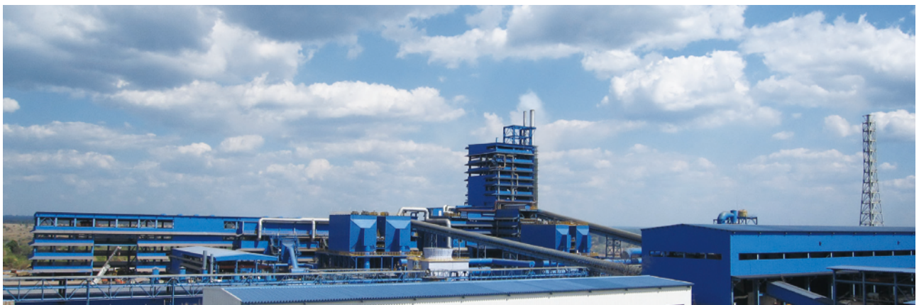
銅冶煉公司廠房全景